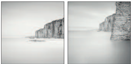
TINEKE THIELEMANS BRONZEN