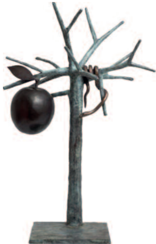
GREETJE SIEDERS SIERADEN